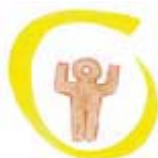
Κέντρο Ημέρας για Παιδιά με Αναπτυξιακές Διαταραχές ΕΨΥΠΕΑ-Μεσολόγγι